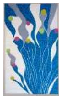
鶴田昌子様 「Dream of shining」